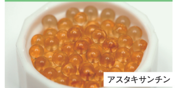
アスタキサンチン