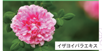
イザヨイバラエキス